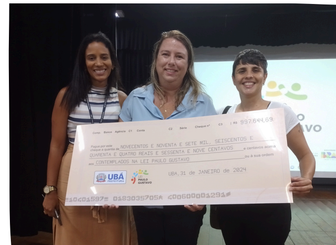
Lei Paulo Gustavo – “Prêmio Mais Cultura”