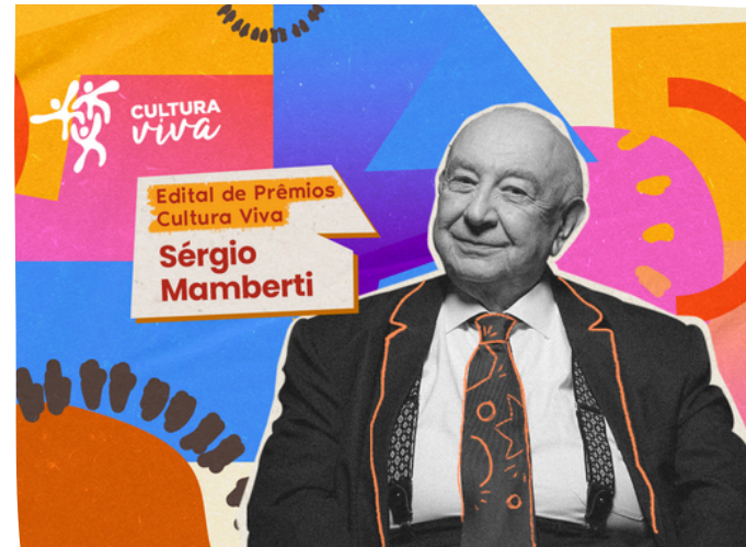
Prêmio Ponto de Cultura Viva, pelo Edital de Premiação Cultura Viva – Sérgio Mamberti