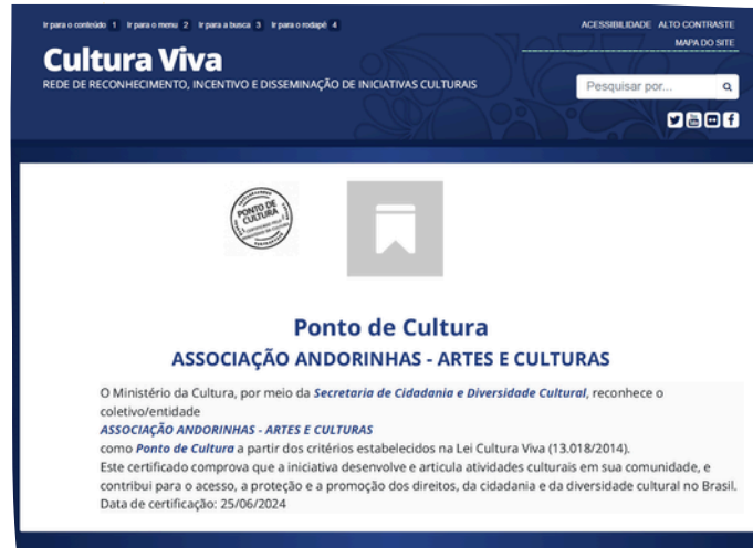
Ponto de Cultura – Rede Cultura Viva do MinC