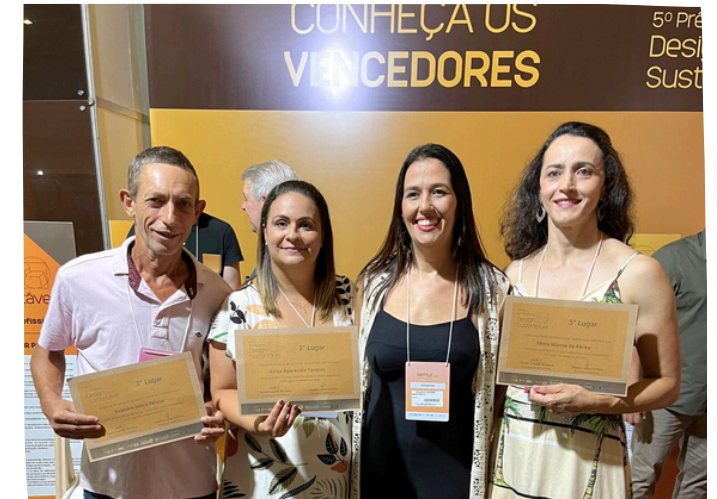
5º Prêmio Design Sustentável – 3º Lugar na categoria artesão